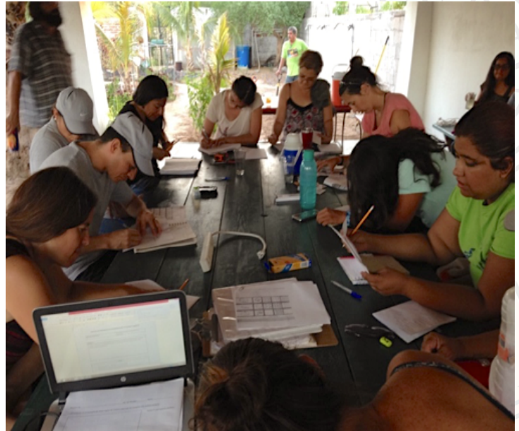
Parceleros haciendo plan de siembra

En Huerto Legaspy se brindan espacios para creación de parcelas de producción donde se acompaña a los participantes (parceleros) en el aprendizaje de los procesos de siembra, cuidado y cosecha de sus hortalizas y se crea comunidad entre los parceleros con las reuniones participativas y los convivios. Este año se inicio con parcelas destinadas al proyecto de Rescate de Alimentos donde se siembran alimentos que no se donan con frecuencia como zanahorias, acelgas, lechugas entre otras. En Legaspy se brinda el espacio para que nuestros colaboradores o la misma comunidad facilite actividades alternativas como pláticas, capacitaciones y talleres de concientización que promuevan un entorno y vida saludable.