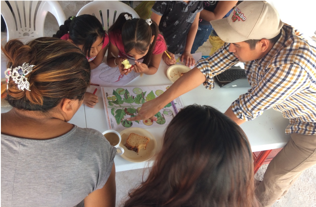
Taller Reconociendo Insectos a mamás y niños (as) de Villas de Guadalupe

Que bueno que nos ofrecen este tipo de pláticas tan básicas y prácticas, me han servido para no dejar de lado mi pequeña huerta.