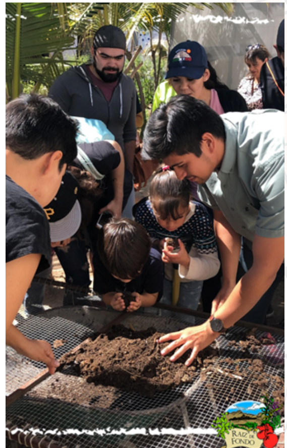
Taller de Composto en Huerto Guamuchil