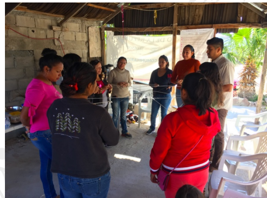
Las señoras de Villas de Guadalupe y Ampliación Vista Hermosa participando en talleres de Consolidación de Grupo.