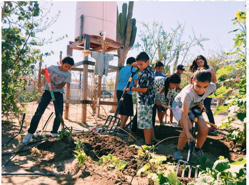
Estudiantes de la Colonia La Pasión removiendo la tierra

Este programa trabaja principalmente el ámbito de la autonomía curricular; incidiendo en los espacios curriculares de desarrollo personal y social, acompañando a los estudiantes en el cambio de hábitos, la exploración y comprensión del mundo natural y social a través de la creación de huertos en las escuelas para que los estudiantes desarrollen competencias necesarias que promuevan la producción y el consumo de hortalizas, frutos y legumbre.