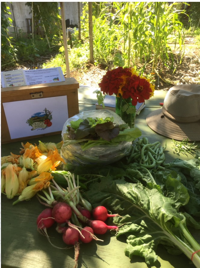
Todos los sábados "Tú lo Cosechas"

Raíz de Fondo es una organización que cumple 8 años brindando oportunidades de aprendizaje sobre agricultura biointensiva y Orientación Alimentaria para todas las edades y niveles socio-económicos.